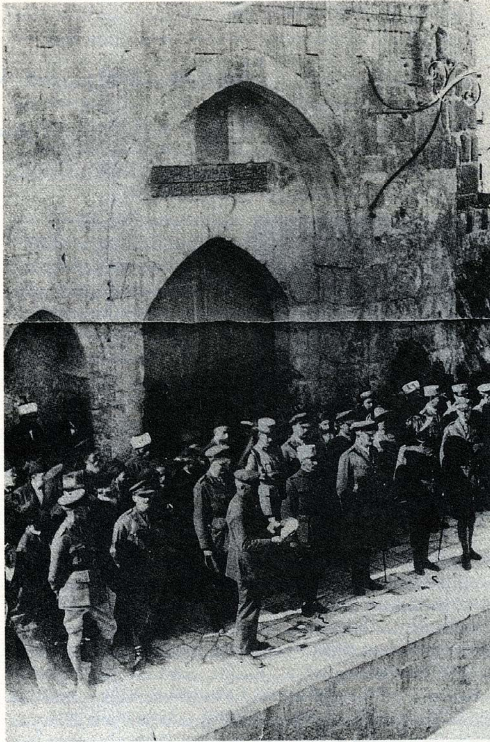
الجنرال اللنبي في قلعة القدس عند بوابة يافا بعد استسلام المدينة للقوات البريطانية.